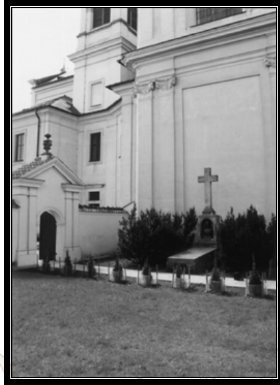
Grób Stanisława Staszica